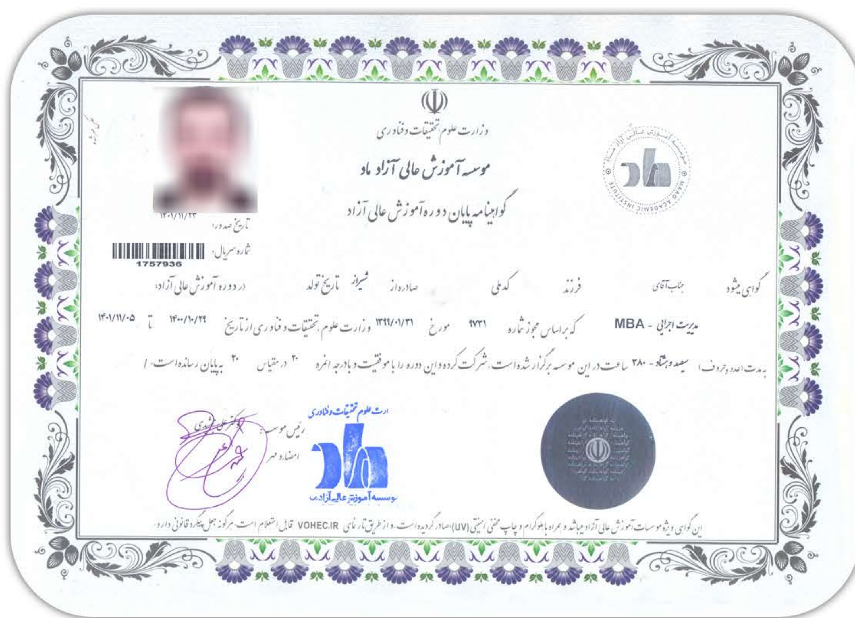
( نمونه مدرک MBA )

موسسه آموزش عالی آزاد ماد، با مجوز شماره ۲۴/۳۰۰۷ مورخ ۱۳۸۵/۸/۸ از وزارت علوم تحقیقات و فناوری، در زمینه های مدیریت کامپیوتر، زبان های خارجی و روانشناسی فعالیت می نماید. گواهینامه های MBA که توسط این موسسه صادر می گردد، قابل ترجمه رسمی بوده و در سراسر دنیا دارای ارزش قانونی می باشد.