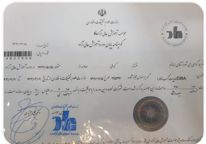
نمونه ای از گواهینامه DBA