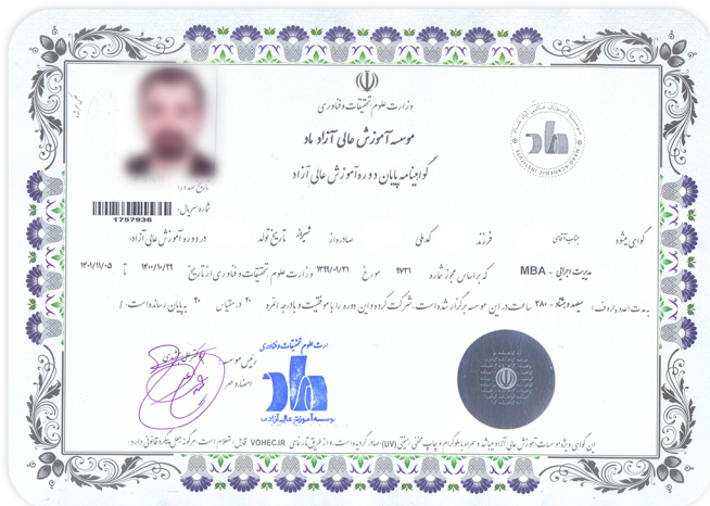
نمونه ای از گواهینامه MBA

موسسه آموزش عالی آزاد ماد، با مجوز رسمی وزارت علوم و بهره گیری از اساتید مجرب، مفتخر است به عنوان یک موسسه کسب و کار (Business School) ، محتوایی کاملاً کاربردی و متناسب با نیاز روز بازار کار، به صاحبان کسب و کارها ارائه می دهد. گواهینامه پایان دوره که توسط موسسه ماد صادر می گردد، مورد تأیید وزارت علوم بوده و دارای ارزش ترجمه رسمی (با مهر دادگستری و قوه قضائیه) می باشد. این گواهینامه ها توسط موسسه (WES (World Education System)، که مدارک مهاجرین را در سراسر دنیا ارزیابی می کند، به عنوان یک گواهینامه آموزش عالی ارزیابی شده و دارای اعتبار بین المللی می باشد.